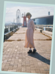
壁や地面の余白や 濡い影を生かした写真が好ま◎