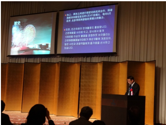
中尾下関市長によるシティプロモーション